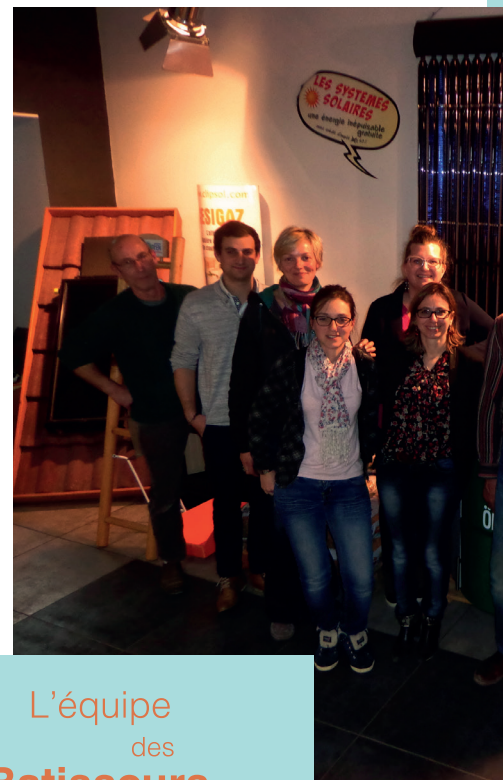
L'équipe des Bâtisseurs en Albret

Notre investissement nous a permis d'acquérir une certaine notoriété dans le milieu professionnel.