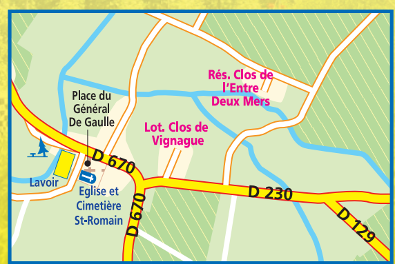
Bourg de St Romain de Vignague