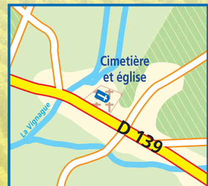
Bourg de St Léger de Vignague