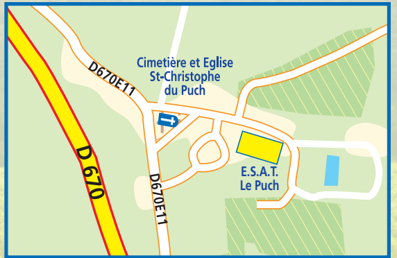
Bourg du Puch