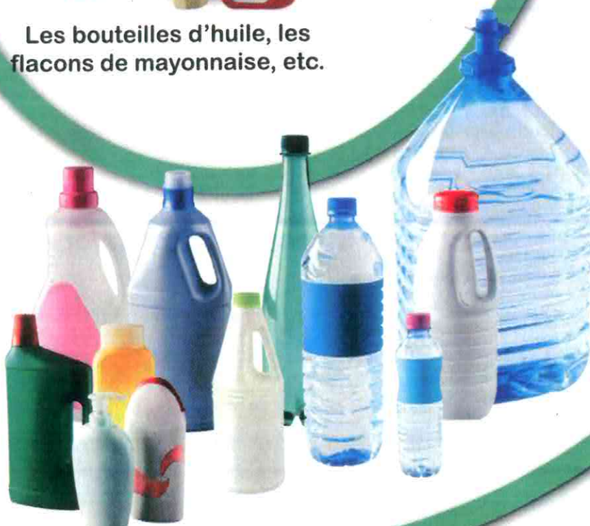
Les bouteilles et les flacons en plastique