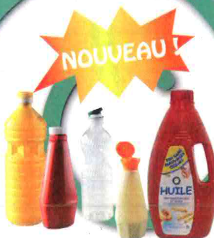
Les bouteilles d'huile, les flacons de mayonnaise, etc.