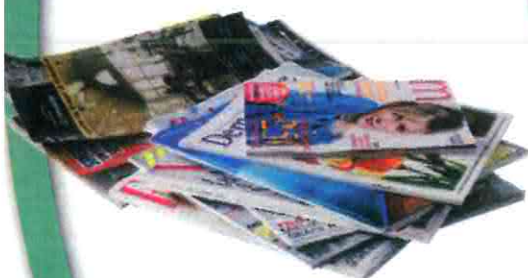
Les journaux et magazines sans le film plastique