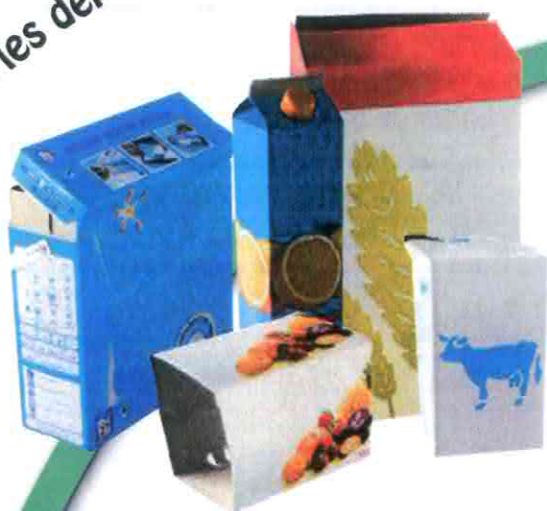
Les emballages en carton et les briques alimentaires vides

Je les dépose vides dans ma Caissette de Tri ou dans une Borne d'Apport Volontaire.