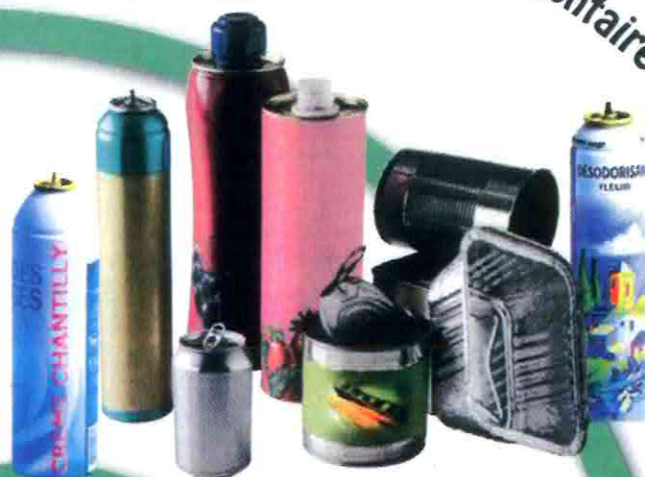
Les emballages métalliques