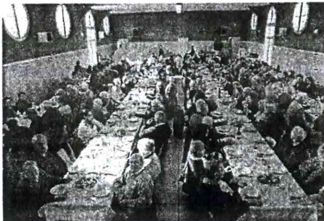
Le repas du CCAS a réuni 250 convives

Le CCAS poursuit les travaux engagés à la RPA. Cette année une tranche de travaux a été effectuée sur les gouttières et les avant toits. Un tiers des bandeaux ont été remplacés – Coût de l'opération 11 300 €. Une nouvelle tranche sera faite chaque année. Les résidents peuvent désormais recevoir la TNT. L'achat de sonnettes est à l'ordre du jour du prochain Conseil du CCAS, ainsi que la pose d'éclairages supplémentaires.