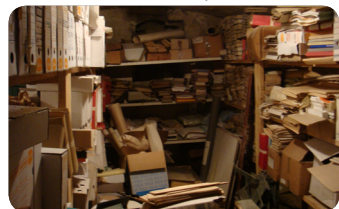
Archives municipales : avant / après

Mais la question de savoir ce que j'ai fait induit, de fait, la question de savoir ce que je n'ai pas fait, ou pas su faire, ou pas pris le temps de faire...et cette question est évidemment nettement plus délicate !