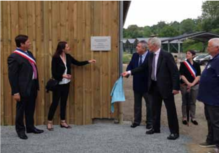
Garage en bois des Services Techniques municipaux

Le samedi 28 mai 2016, ont été inaugurées, en présence du Conseil Municipal, de Monsieur le Préfet de Région, des autorités civiles et militaires et des habitants de Sauveterre de Guyenne, les réalisations suivantes :