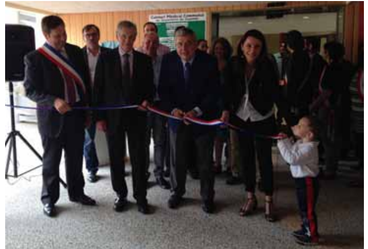
Cabinet Médical Communal (Phases 1 et 2)