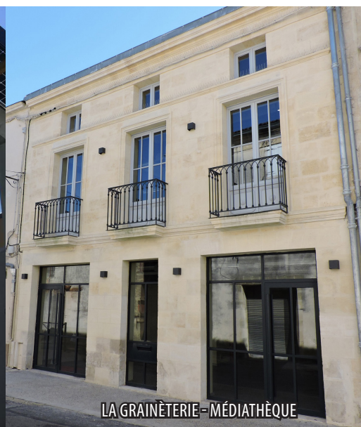
LA GRAINÈTERIE - MÉDIATHÈQUE