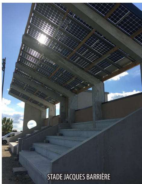
STADE JACQUES BARRIÈRE